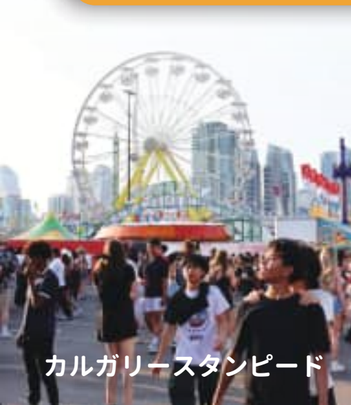
カルガリースタンピード

世界に名だたる都市の活気とロッキー山脈の壮大さを体感できる街 カルガリーで留学しよう！