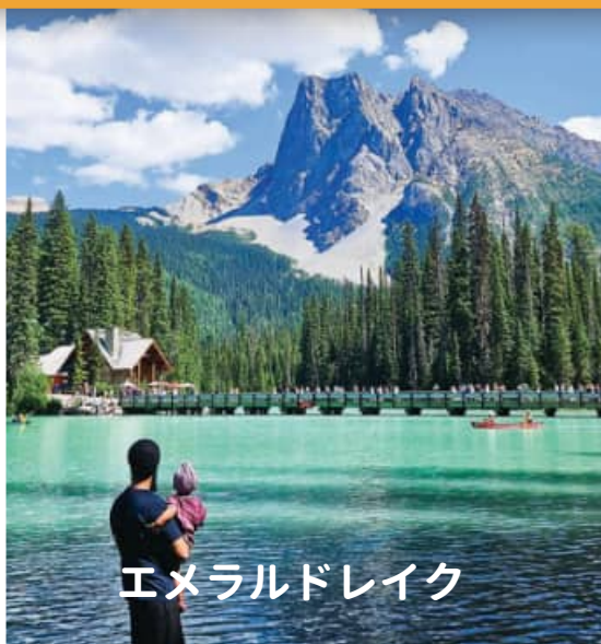
エメラルドレイク