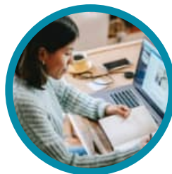
デスク付きの 個室