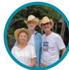
多文化な国・カナダを 反映する様々なホスト ファミリー