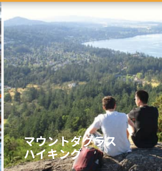
マウントダグラス ハイキング