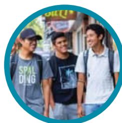
学校までの距離: 40~60分