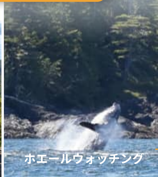
ホエールウォッチング